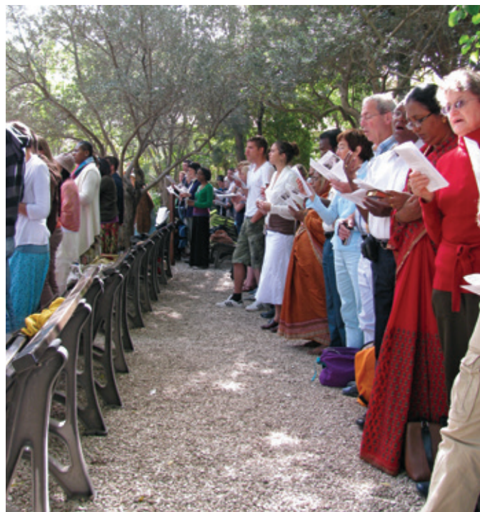
▲ טקס פסחא רב תרבותי 2010. Plate 101: Multicultural Easter Sunday at the Garden, 4.4.10