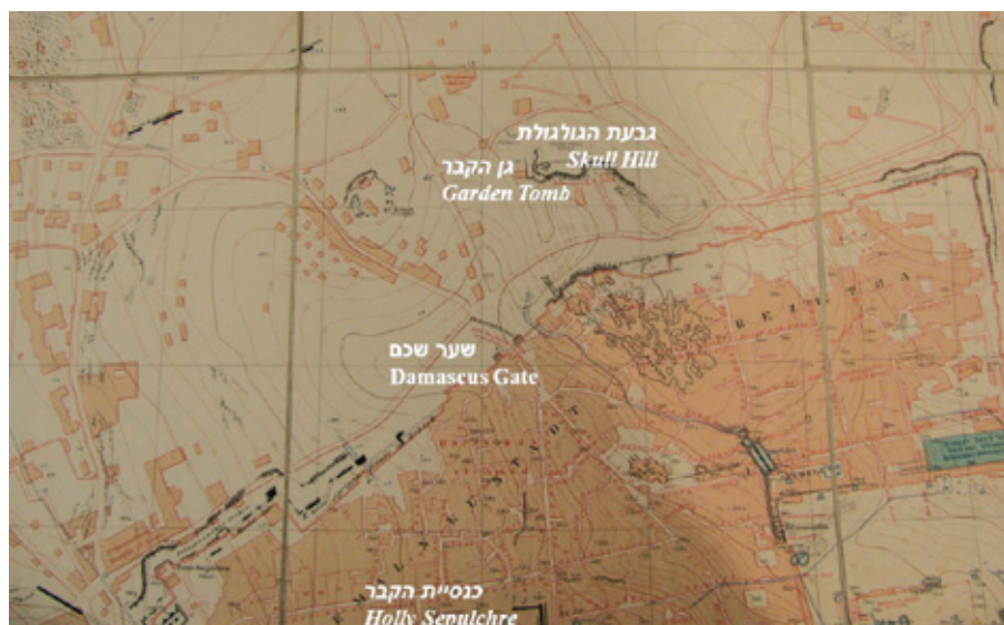
▲ מפת קומל 1904

גנים הינם אתרים רבי משמעות בתיאולוגיה הנוצרית - מקומות התרחשותם של אירועי נס דרמטיים. ישו נתפש כאדם השני אשר ישיב את