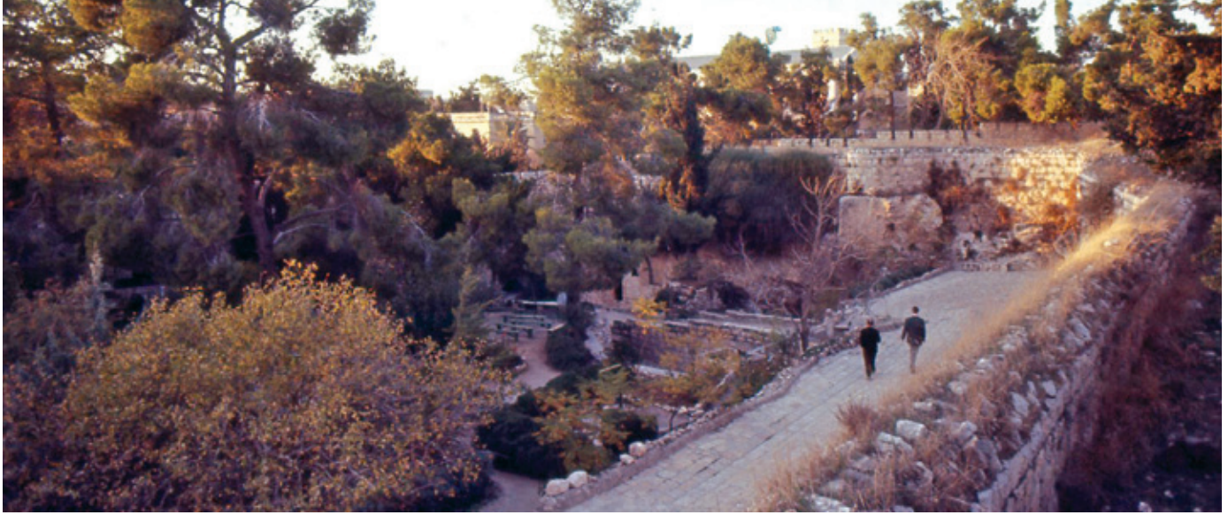
▲ הגן ב-1969 עם ספסלים קבועים. (לא בשעת טקס).