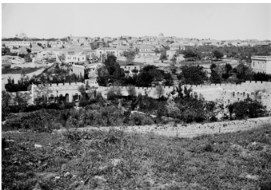
▲ הגן מוקף החומה ב-1910 Jerusalem (El-Kouds). Jerusalem from Gordon's Calvary, American Colony (Jerusalem). Photo Dept. צילום: .