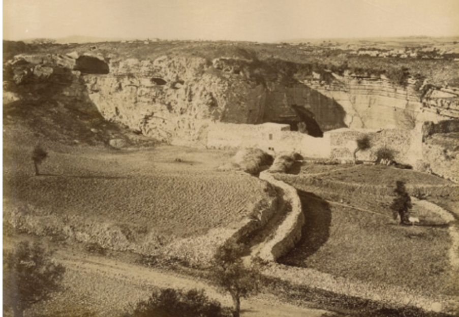
▲ גבעת הגולגותא ב-1880 בקירוב Grotte de Jérémie