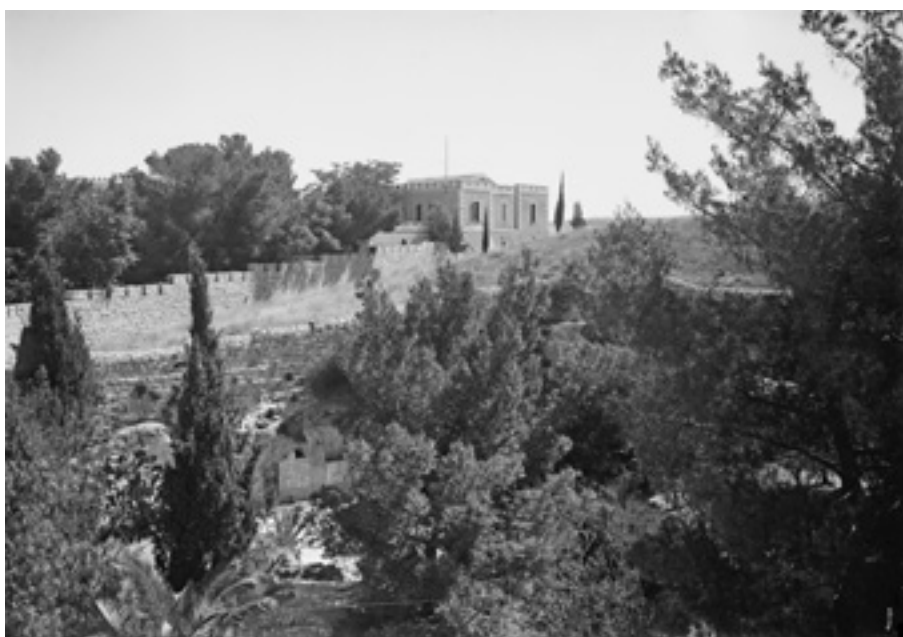
▲ הגן ב-1935 Pan. [i.e., panorama] of Garden Tomb , American Colony (Jerusalem). Photo Dept. צילום: .