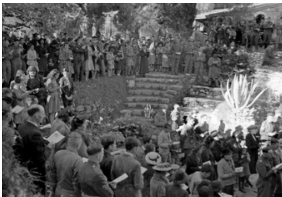
▲ טקס פסחא בגן הקבר 1942. צילום: crowd in garden during service :, American Colony (Jerusalem). Photo Dept.