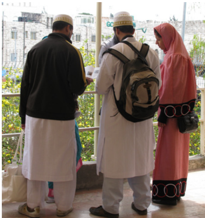
▲ מוסלמים בתצפית הגולגולת 2012. צילום מיכל ביטון 29.3.12

האופי הטבעי והמעט פראי של הגן, שהתפתחה בו עם השנים כעין חופה ירוקה של עצים גבוהים המסתירה מבטים וחוסמת רעשים מהסביבה, מזמין אל הגן גם פעילות חילונית לחלוטין. הגן הופך למקום המזמן מפגשים נדירים (מיסות קתוליות לצד קומוניון פרוטסטנטי, שבת הקדושה בשיתוף ערבים נוצרים והיהודים משיחיים) ואסורים (רומנים של צעירים ערבים תושבי השכונה) ומספק יצר סקרנות ומציצנות של תושבי הסביבה המוסלמים ומבקרים יהודיים. במקום מתקיימת אשליה של תחושת חופש המושכת חדירה אל הגן התחום ושימוש בו כאתר מסתור לפריקת מתחים שמפעילה החברה השמרנית שמחוצה לו. המניע המרכזי של מפגש המשיחיים-פלסטיניים באיסטר (Easter) הוא דתי, אך הוא גם מאפשר מפגש נדיר בין שני הצדדים המעורבים בסכסוך הגיאופוליטי ובכך מאפשר הזדמנות לשחרר מתחים פוליטיים ותרבותיים בין שתי האומות. יתר על כן, הגן מספק מענה לאוכלוסייה הפלסטינית הסובלת ממחסור גדול בשטחים פתוחים ירוקים.