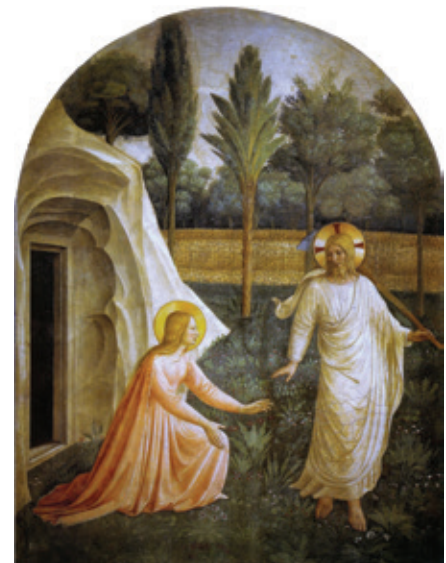
▲ ישו כנגן בגן הקבר

Kümmel's map, 1904: A. Kümmel, Karte der Meterialien zur Topographie des Alten Jerusalem [cartographic material], Verlag des Deutschen Palaestina-Vereins, Leipzig, 1904. http://www.jnul.huji.ac.il/dl/maps/jer/html/jer093.htm