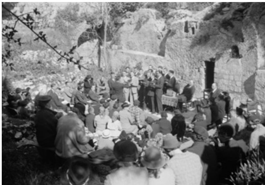
▲ טקס פסחא - המקהלה בחזית הקבר 1939. The choir singing at the Service

עם זאת נוסעים רבים חזרו להדגיש את אי החשיבות של זיהוי מיקומו האמיתי של הקבר - כחלק מהתיאולוגיה הפרוטסטנטית המדגישה את העובדה כי הקבר הינו ריק והאל נוכח בכל מקום. כך למשל ארצ'יבלד פורדר (Forder) אשר טען כי ערכו של הקבר הוא בכוחו להמחיש את הנרטיב בגוספל, אך מלבד זאת אין טעם בזיהוי המקום האמיתי. אפילו הגנרל צ'ארלס גורדון - גיבור ויקטוריאני אשר עיקר פרסומו של גולגותא החדשה מיוחס לתמיכתו הבלתי מסויגת באתר, הביע ספקותיו לגבי חשיבות המקומות הקדושים והמליץ לאחותו לא להגיע למסע לארץ הקודש.